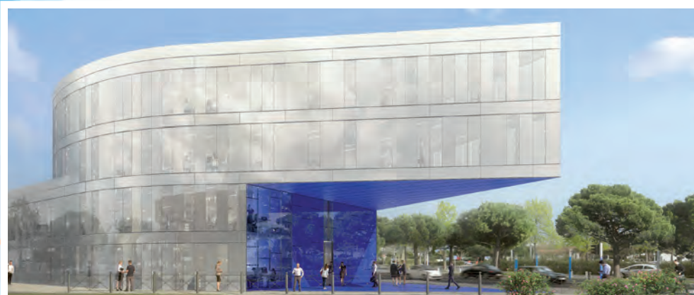
L'Ammonite - Immeuble de bureaux - 3000m 2 - Montpellier (34)