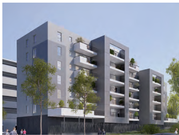
Les Terrasses du Parc - 58 logements - Montpellier (34)

Notre volonté est de nous inscrire dans la durée au côté du MHSC.