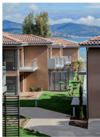
Kube - Hôtel 5* - 25 chambres - Gassin (83)