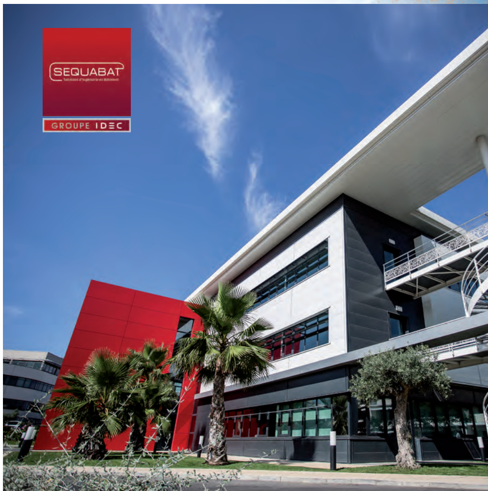
L'Aéroplane - siège social de SEQUABAT - 2000 m 2 - Pérols (34)

Nous sommes engagés auprès du MHSC jusqu'à la fin de la saison 2017/2018. L'objectif de ce partenariat est de faire rayonner SEQUABAT et que le club remporte de nombreuses victoires avec les couleurs de notre entreprise et d'IDEC SPORT.